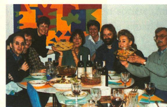
Université de Bâle

On entend souvent dire que la mélatonine serait une façon naturelle de lutter contre les troubles du sommeil, qu'elle guérirait l'impuissance, renforcerait le système immunitaire, prolongerait la vie et guérirait même la maladie d'Alzheimer ou le cancer. Des médecins et des chercheurs mettent toutefois en garde contre son ingestion incon-