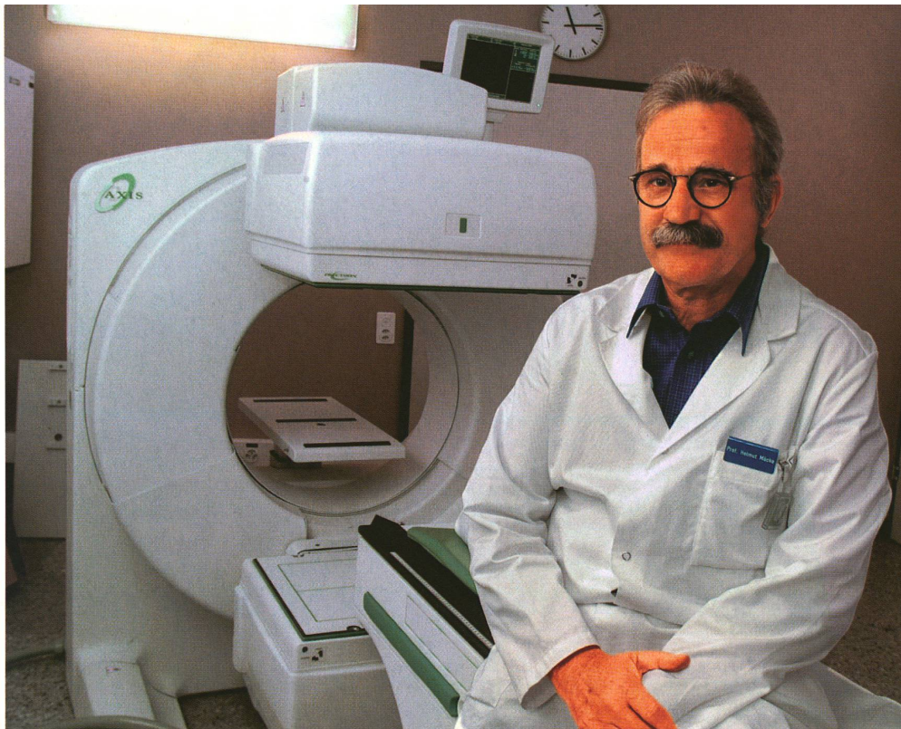
Le professeur Helmut Mäcke devant la caméra à rayons gamma qui permet de réaliser les scintigrammes d'un corps entier.

Au total, l'équipe scientifique bâloise a déjà synthétisé près de cent nouveaux radiopeptides, testés sur des lignes cellulaires et au cours d'expérimentations animales. Les chercheurs ont combiné quatre hormones avec différents agents radioactifs. Ils ont réussi à accoupler même plusieurs molé-