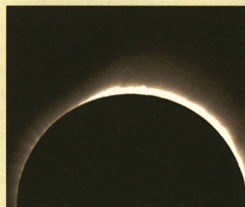
1954: la structure rayonnante de la couronne du soleil du pôle Nord.