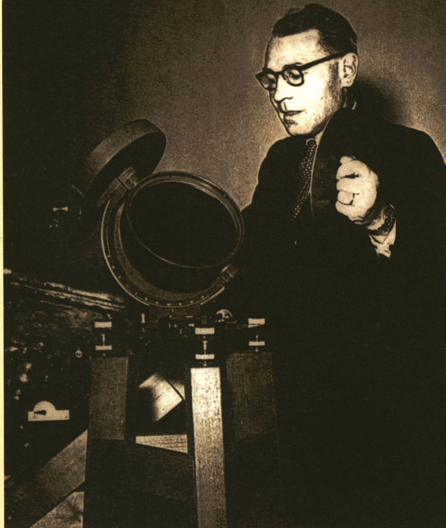
Max Waldmeier (photo prise en 1952) contrôle les instruments qu'il prendra pour ses expéditions.

de soleil totale. C'est ainsi que l'astronome décide de compléter sa recherche par des observations intensives dans des conditions idéales.