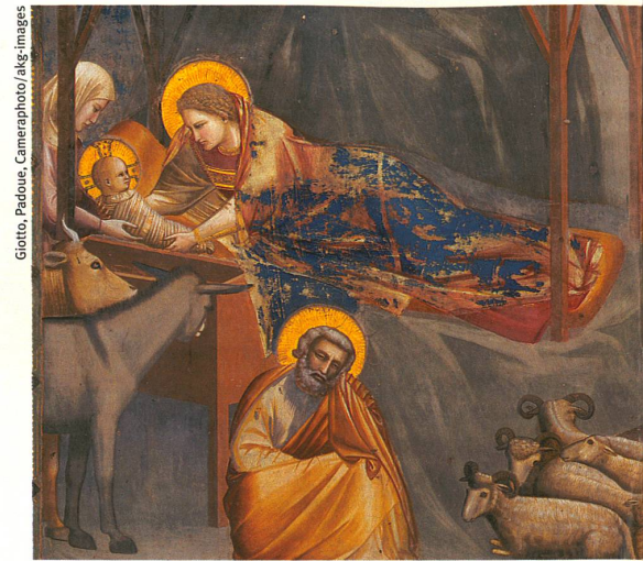
Giotto, Padoue