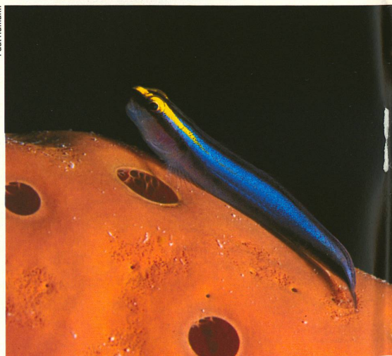
Biodiversité : les gobies sont les pinsons de Darwin de la mer.