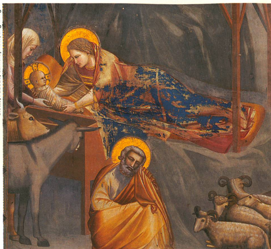
L'image de la Vierge à l'enfant est bien antérieure au christianisme.