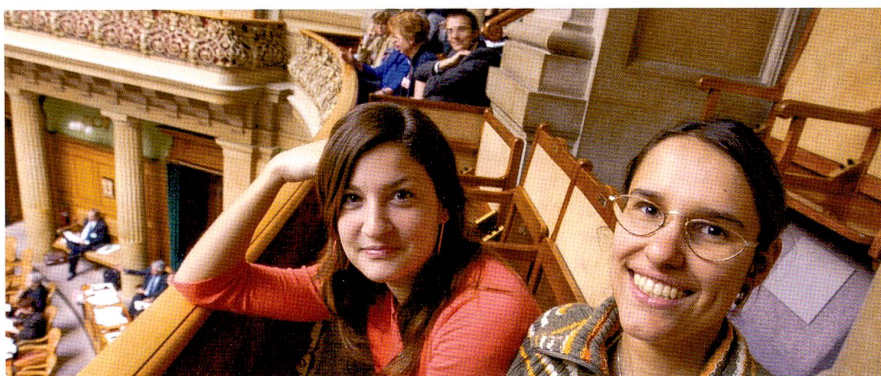
Des «secondos» intéressées par la politique, dans la tribune du public du Conseil national.