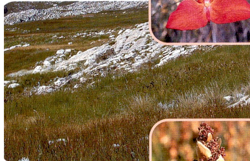
Elegia extensa (Restionaceae)