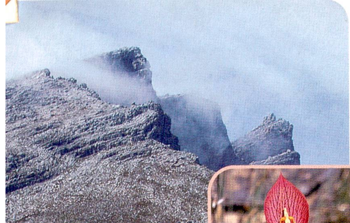
Disa uniflora (Orchidaceae)