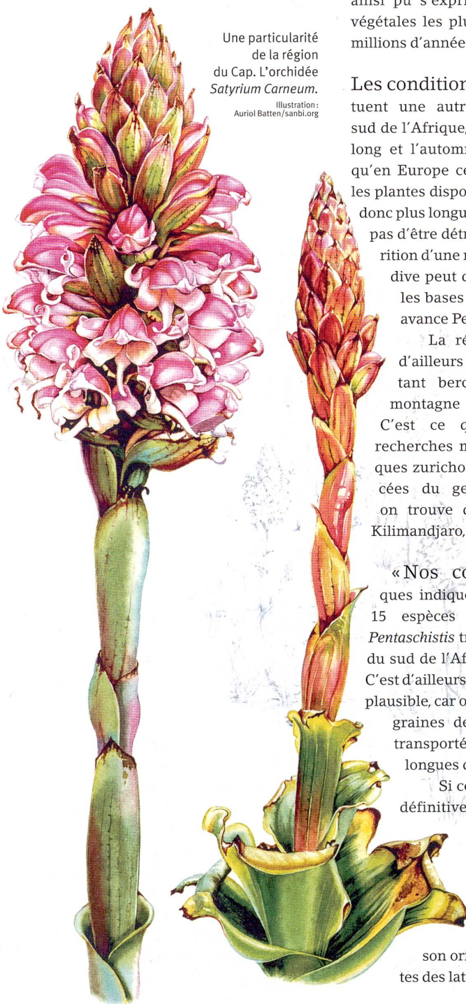
Illustration: Auriol Batten/sanbi.org

Une particularité de la région du Cap. L'orchidée Satyrium Carneum .