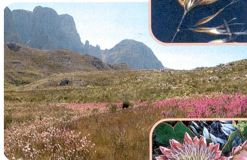
Protea cynaroides (Proteaceae)