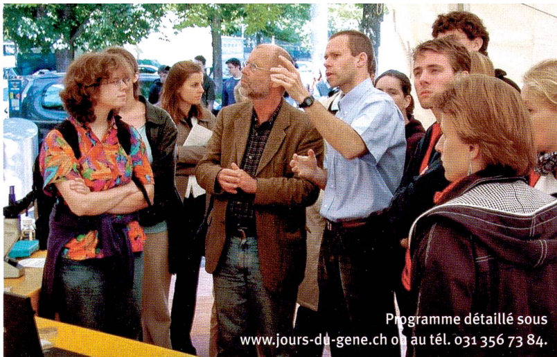
Programme détaillé sous www.jours-du-gene.ch ou au tél. 031 356 73 84.

«Horizons», Fonds national suisse Wildhainweg 20, 3001 Berne fax: 031 308 22 65, E-mail: pri@snf.ch