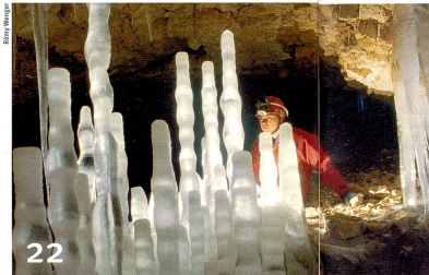
L'étude des glaciers du Jura donne de précieuses indications sur l'évolution du climat.