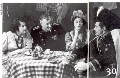
Le premier grand dictionnaire sur le théâtre en Suisse.