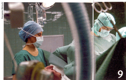
Chercheurs et médecins développent de nouvelles thérapies contre le cancer.