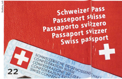
L'obtention du passeport suisse est une course d'obstacles.