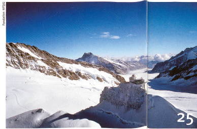
Jungfrauoch: la plus haute station de recherche d'Europe à 75 ans.