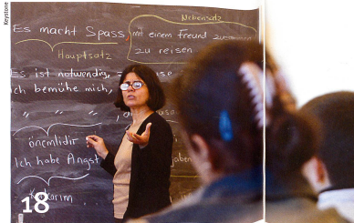
Des cours donnés dans leur langue maternelle améliorent les compétences linguistiques des jeunes étrangers.