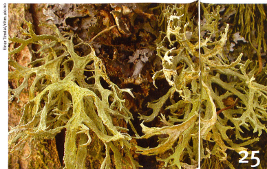
Les lichens recèlent encore beaucoup de mystères. Des chercheurs zurichois en ont élucidé quelques-uns.