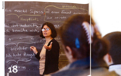
Des cours donnés dans leur langue maternelle améliorent les compétences linguistiques des jeunes étrangers.