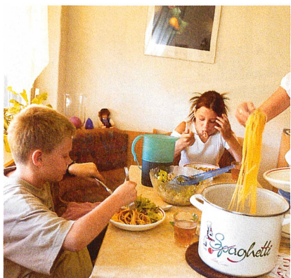
L'étude du professeur Wanner met en évidence les transformations des modes de vie des enfants.