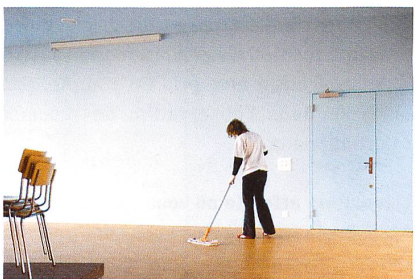
La précarité du travail et de l'emploi a aussi des conséquences négatives sur le bien-être psychique.