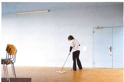
La précarité du travail et de l'emploi a aussi des conséquences négatives sur le bien-être psychique.