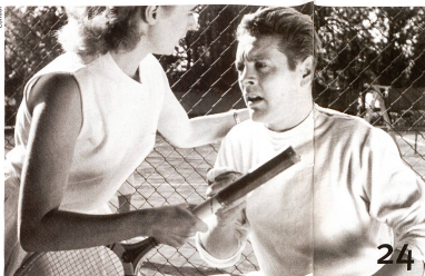
Longtemps oubliés, les anciens documentaires suisses suscitent à nouveau de l'intérêt.