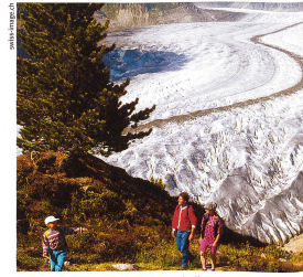
Les traces d'anciens glaciers ont permis, il y a 200 ans, aux géologues de faire des découvertes sur la formation de la Terre.