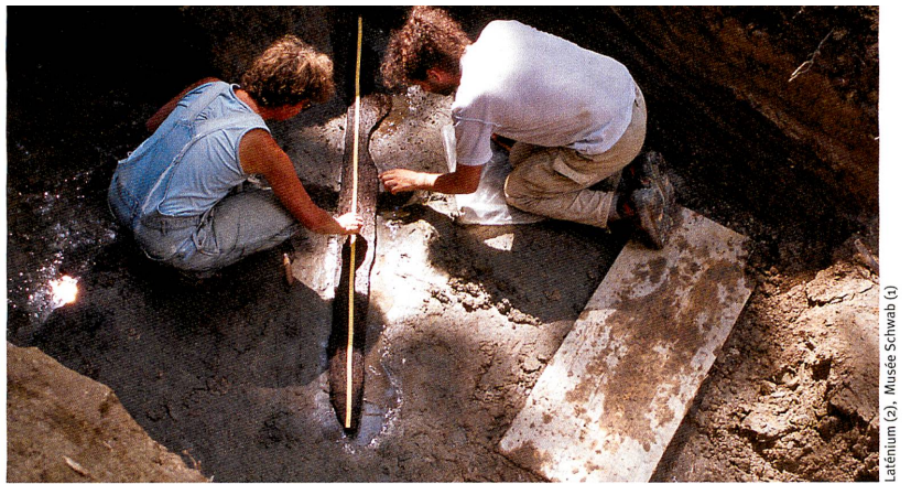
Laténium (2), Musée Schwab (3)

Questions et réponses sont tirées du site du FNS www.gene-abc.ch qui informe de manière divertissante sur la génétique et la technologie génétique.