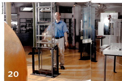
La science descend dans l'arène publique.