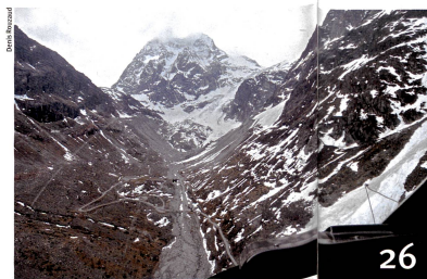
Les effets du réchauffement climatique sur les ressources en eau dans les Alpes.

Photo de couverture en haut : Le pédopsychiatre Hans-Christoph Steinhausen