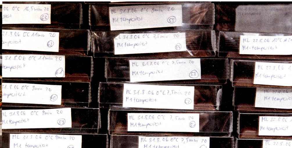
La précristallisation (en bas à gauche) est une étape décisive. Elle est responsable de la consistance et de l'onctuosité du chocolat. Celui-ci est ensuite conditionné en tablettes qui sont entreposées à une température de 18 degrés (en haut).