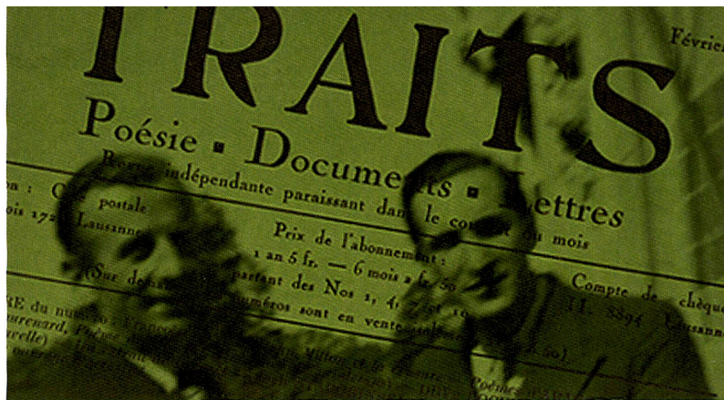
Musée historique de Lausanne, Mémorial de la Shoah

Questions et réponses sont tirées du site du FNS www.gene-abc.ch qui informe de manière divertissante sur la génétique et la technologie génétique.