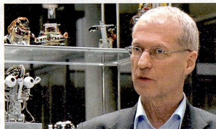
Le roboticien Rolf Pfeifer.

SCIENCEsuisse combine 25 courts métrages et une publication richement illustrée, le tout en quatre langues. Ces 25 portraits montrent combien la curiosité est le carburant des chercheurs, ces passionnés motivés à lever le voile sur de nouvelles parcelles d'inconnu. La série donne un panorama varié de la place scientifique suisse. Elle offre un aperçu des principaux thèmes sur