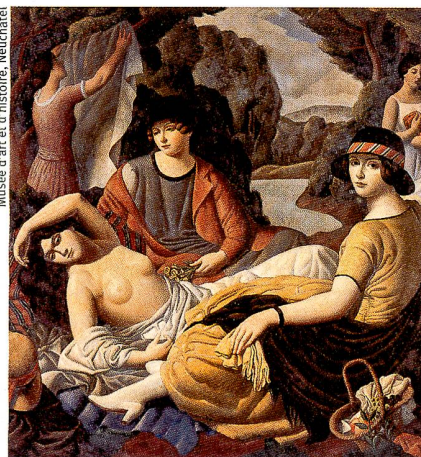
«Après le bain», 1921-22