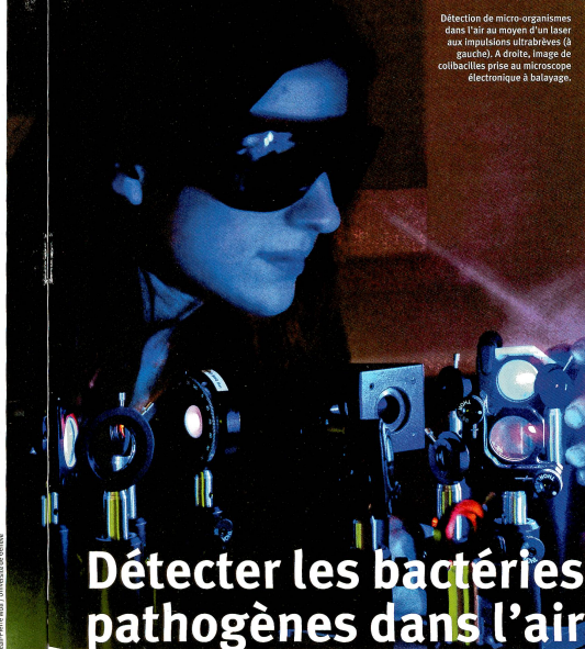
Détection de micro-organismes dans l'air au moyen d'un laser aux impulsions ultrabrèves (à gauche). À droite, image de colibactéries prises au microscope électronique à balayage.

S'il est relativement aisé de distinguer la première catégorie des deux autres, il est beaucoup plus difficile de faire la différence entre les grains de suie et les bactéries qui ont des compositions chimiques très semblables. Tous sont constitués de « composés aromatiques polycycliques » – des molécules formées de cycles d'atomes de carbone. Toutefois, dans les micro-organismes, ces cycles sont munis de « bras » d'acides aminés,