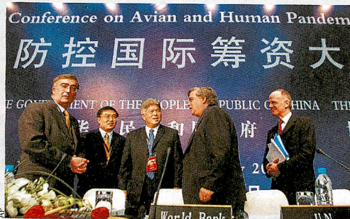
« Cela reste une maladie animale. Mais le risque d'une pandémie est grand », a lancé une responsable de l'OMS.

» En Turquie, le virus vient de tuer une jeune fille de 16 ans, quatrième victime de la maladie hors d'Extrême-Orient. Vingt et une personnes ont été contaminées dans le pays depuis fin décembre, rappelant la réalité de la menace à ceux qui pensaient la contagion humaine limitée à l'Asie. AFP