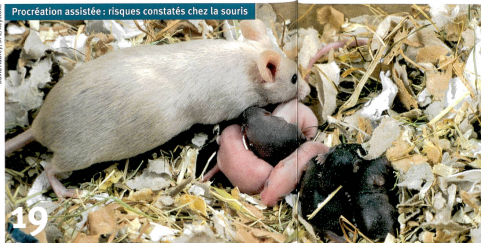
Procréation assistée : risques constatés chez la souris