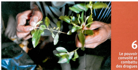
6 Le pouvoir convoité et combattu des drogues