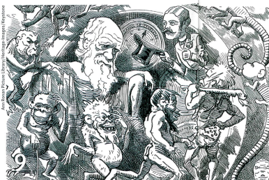
Darwin penseur controversé, ici dans une caricature de 1882.