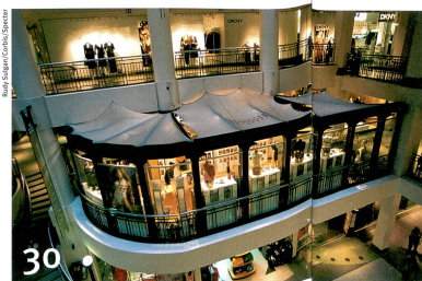
Comment mieux exploiter le sous-sol des villes, à l'exemple de Montréal.