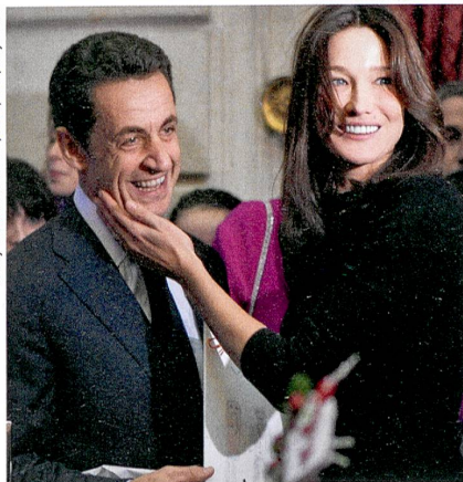
Une relation marquée par le narcissisme ? Nicolas Sarkozy et Carla Bruni-Sarkozy (2009).