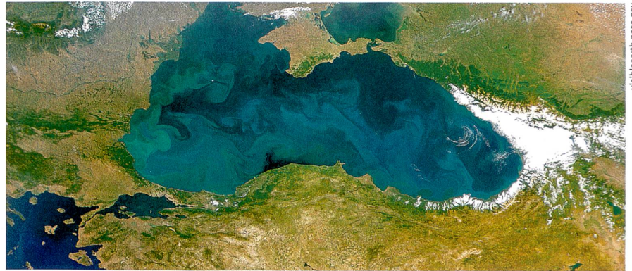
Tantôt douce, tantôt salée. Photo satellite de la mer Noire (2006).

Lorsque l'on évoque la contribution de l'homme au réchauffement du climat, on accuse généralement le CO 2 rejeté dans l'atmosphère à l'ère industrielle (dès 1850). Or, depuis 8000 ans, on observe une augmentation des gaz à effet de serre que sont le CO 2 et le méthane, bien que selon les variations cycliques du climat, la Terre devrait se refroidir en vue de la prochaine glaciation, et ces gaz diminuer dans l'atmosphère. Des scientifiques ont avancé l'hypothèse d'une contribution humaine à cette augmentation préindustrielle du CO 2 . Le carbone est en effet stocké par la végétation, laquelle est modifiée par la chasse, la pâture et l'agriculture. Nos ancêtres utilisaient le sol plus extensivement, et donc une plus grande surface par habitant qu'aujourd'hui. Partant de ce constat, l'équipe du professeur boursier Jed Kaplan de l'EPFL a estimé l'utilisation du sol par nos ancêtres, à l'aide de données relatives à la végétation et au nombre d'habitants. L'utilisation du sol a servi à prédire la quantité de CO 2 dérivé des activités humaines. Les résultats de l'étude suggèrent que l'utilisation du sol par l'homme entre 6000 av. J.C. et 1850 a généré de fortes émissions de CO 2 . Ces conclusions contrastent avec celles de recherches précédentes et militent en faveur de l'hypothèse d'une influence humaine préindustrielle sur le climat. Anne Burkhardt ■