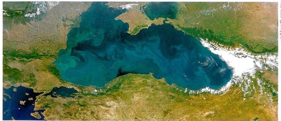
Tantôt douce, tantôt salée. Photo satellite de la mer Noire (2006).

Lorsque l'on évoque la contribution de l'homme au réchauffement du climat, on accuse généralement le CO 2 rejeté dans l'atmosphère à l'ère industrielle (dès 1850). Or, depuis 8000 ans, on observe une augmentation des gaz à effet de serre que sont le CO 2 et le méthane, bien que selon les variations cycliques du climat, la Terre devrait se refroidir en vue de la prochaine glaciation, et ces gaz diminuer dans l'atmosphère. Des scientifiques ont avancé l'hypothèse d'une contribution humaine à cette augmentation préindustrielle du CO 2 . Le carbone est en effet stocké par la végétation, laquelle est modifiée par la chasse, la pâture et l'agriculture. Nos ancêtres utilisaient le sol plus extensivement, et donc une plus grande surface par habitant qu'aujourd'hui. Partant de ce constat, l'équipe du professeur boursier Jed Kaplan de l'EPFL a estimé l'utilisation du sol par nos ancêtres, à l'aide de données relatives à la végétation et au nombre d'habitants. L'utilisation du sol a servi à prédire la quantité de CO 2 dérivé des activités humaines. Les résultats de l'étude suggèrent que l'utilisation du sol par l'homme entre 6000 av. J.C. et 1850 a généré de fortes émissions de CO 2 . Ces conclusions contrastent avec celles de recherches précédentes et militent en faveur de l'hypothèse d'une influence humaine préindustrielle sur le climat. Anne Burkhardt ■