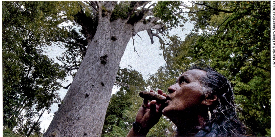
Les troncs des kauris parlent aux climatologues grâce à leurs cernes caractéristiques qui enregistrent les conditions climatiques régionales.