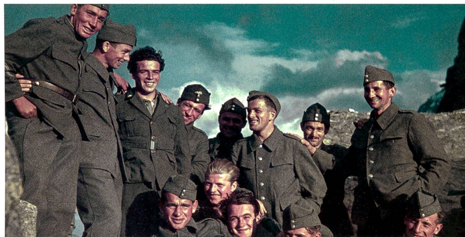
Des soldats suisses à la frontière italienne, en 1940.