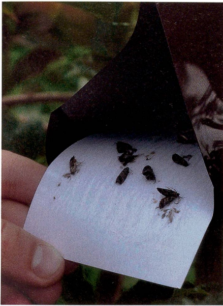
Les pièges à phéromones sont efficaces contre les carpocapses.