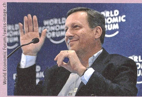
Le salaire et le parachute doré de l'ancien patron de Novartis Daniel Vasella ont suscité la polémique.