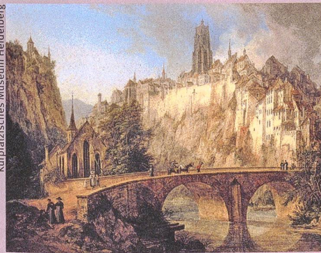
Dans son portrait de la ville de Fribourg (1826), Domenico Quaglio gomme sciemment le progrès technique, l'industrialisation et la pauvreté.

B. Roeck, M. Stercken, F. Walter, M. Jorio, T. Manetsch (éd.): Schweizer Städtebilder. Urbane Ikonographien (15.–20. Jahrhundert) – Portraits de villes suisses. Iconographie urbaine (XVe–XXe siècle) – Vedute delle città svizzere. L'iconografia urbana (XV–XX secolo) . Chronos, Zurich 2013, 640 p., 400 ill. en couleur.