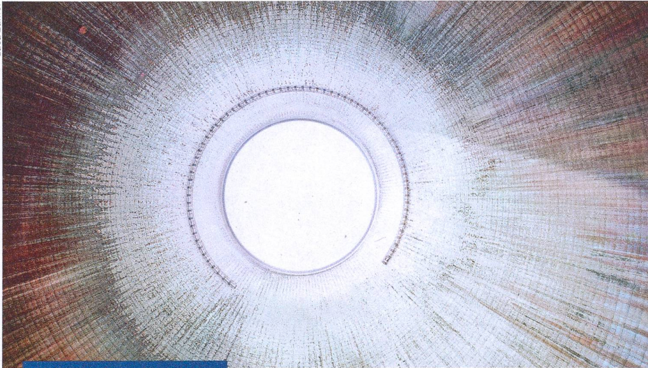
Point fort virage énergétique