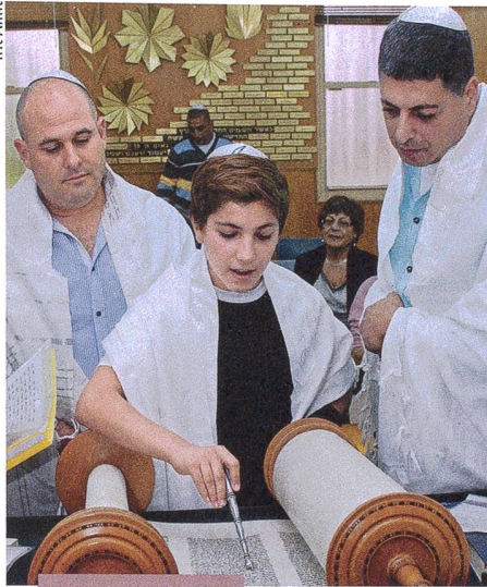
Culture et société

37 Le son qui fait bouger les objets Les Alpes avant les glaciers Science-fiction sur une puce