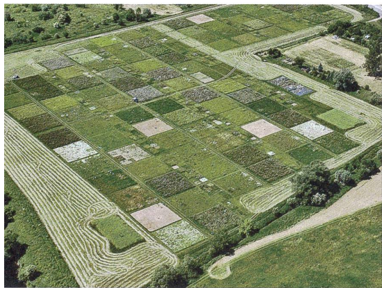
Où les plantes poussent-elles le mieux? Les champs d'essai à Jena.