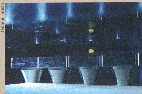
Réaction sans contact. L'acoustophorèse renforce la fluorescence d'un produit chimique (en vert).

D. Foresti, M. Nabavi, M. Klingauf, A. Ferrari, D. Poulikakos (2013): Acoustophoretic contactless transport and handling of matter in air . Proceedings of the National Academy of Sciences of the United States of America (doi:10.1073/pnas.1301860110/-/DCSupplemental).