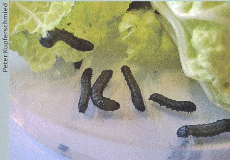
Des chenilles ravageuses ingèrent des feuilles qui ont été traitées avec des bactéries insecticides.