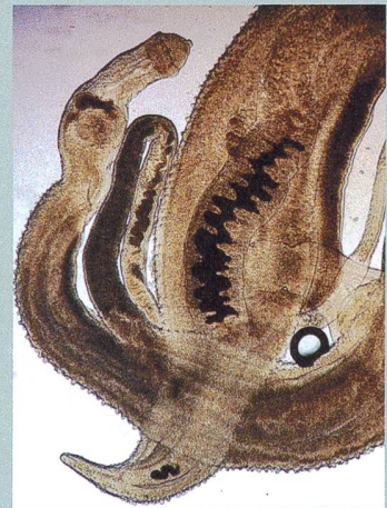
Parasites en action. Des vers à l'origine de la bilharziose.