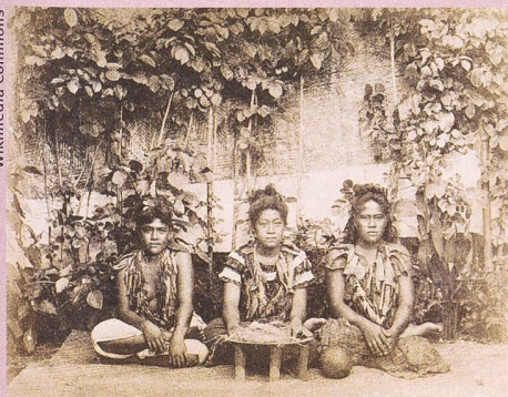
Trois femmes des Iles Samoa préparant du kava. (1890 environ).