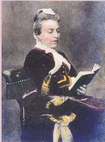
L'écrivaine polonaise Eliza Orzeszkowa, photographée en 1904.