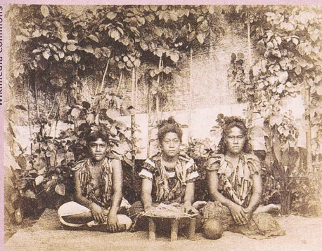
Trois femmes des îles Samoa préparant du kava. (1890 environ).

Christoph B. Graber, Karolina Kuprecht, Jessica C. Lai (éd.) : International Trade in Indigenous Cultural Heritage. Legal and Policy Issues . Edward Elgar, Cheltenham, Northampton 2012, 509 p.