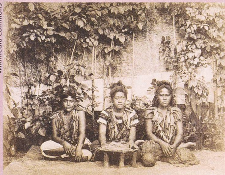
Trois femmes des Iles Samoa préparant du kava. (1890 environ).

Christoph B. Graber, Karolina Kuprecht, Jessica C. Lai (éd.) : International Trade in Indigenous Cultural Heritage. Legal and Policy Issues . Edward Elgar, Cheltenham, Northampton 2012, 509 p.