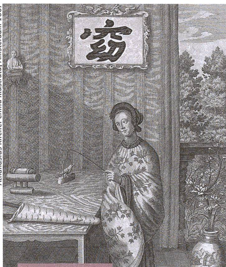
Culture et société

Athanasius Kircher China Illustrata, Amsterdam 1667