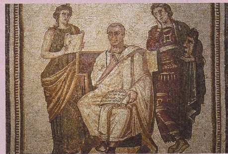
Virgile tenant l'Enéide sur ses genoux, entouré des muses Cléo et Melpomène (mosaïque du IIIe siècle.)

C. Castelletti, Following Aratus' plow: Vergil's signature in the Aeneid (Museum Helveticum 69, 2012, 83–95).