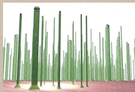
Les nanofils d'arséniure de gallium améliorent le rendement des cellules photovoltaïques.