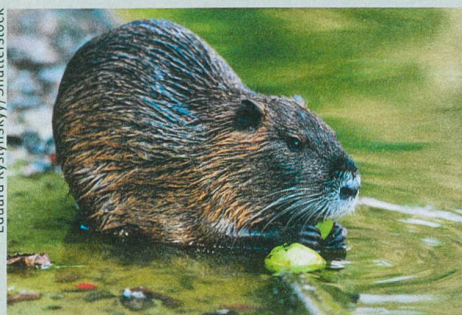
Le rat musqué est également indésirable.

Tim M. Blackburn et al. (2014): A Unified Classification of Alien Species Based on the Magnitude of their Environmental Impacts . PLoS Biology 12: e1001850.