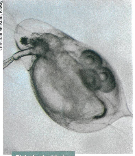
Biologie et médecine