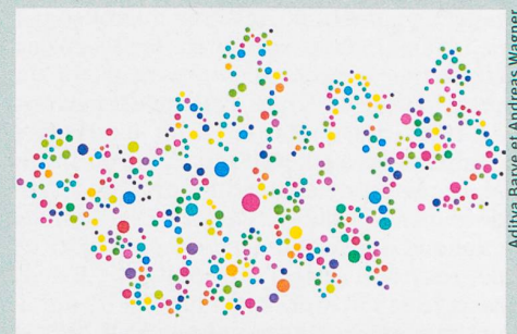
Représentation symbolique des processus métaboliques chez des bactéries virtuelles.

A. Barve & A. Wagner (2013): A latent capacity for evolutionary innovation through exaptation in metabolic systems . Nature 500: 203-206.