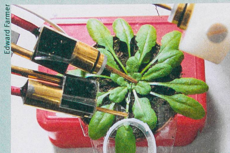
Les électrodes mesurent les signaux électriques de l'arabette des dames.

S. A. R. Mousavi, A. Chauvin, F. Pascaud et al. (2013): GLUTAMATE RECEPTOR-LIKE genes mediate leaf-to-leaf wound signaling . Nature 500: 422-426.