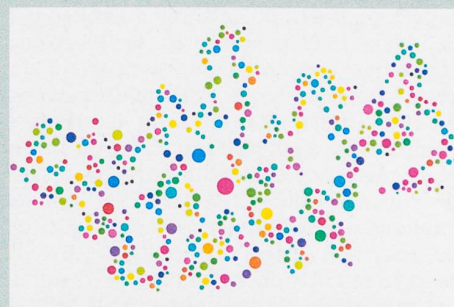
Représentation symbolique des processus métaboliques chez des bactéries virtuelles.

A. Barve & A. Wagner (2013): A latent capacity for evolutionary innovation through exaptation in metabolic systems . Nature 500: 203-206.