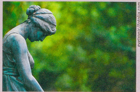
Un grand manque d'estime de soi peut rendre malheureux.

U. Orth, R.W. Robins (2013): Understanding the link between low self-esteem and depression . Current Directions in Psychological Science , 22, 455-460.