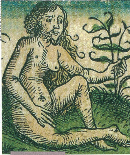
Culture et société