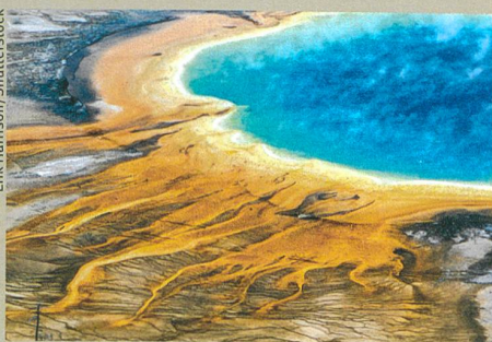
Les traces marquantes de la présence d'un supervolcan dans le parc national de Yellowstone.