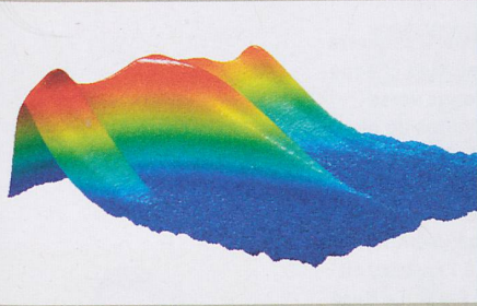
Evolution temporelle (de gauche à droite) du rayonnement optique d'un quantum de nitrure de gallium.